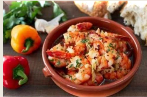
Gambas al ajillo