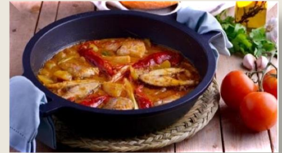
Suquet de peix